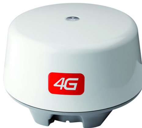
3G og 4G antennen har samme ytre mål

(dersom problemer med linkene, kopier dem inn i nettleseren)