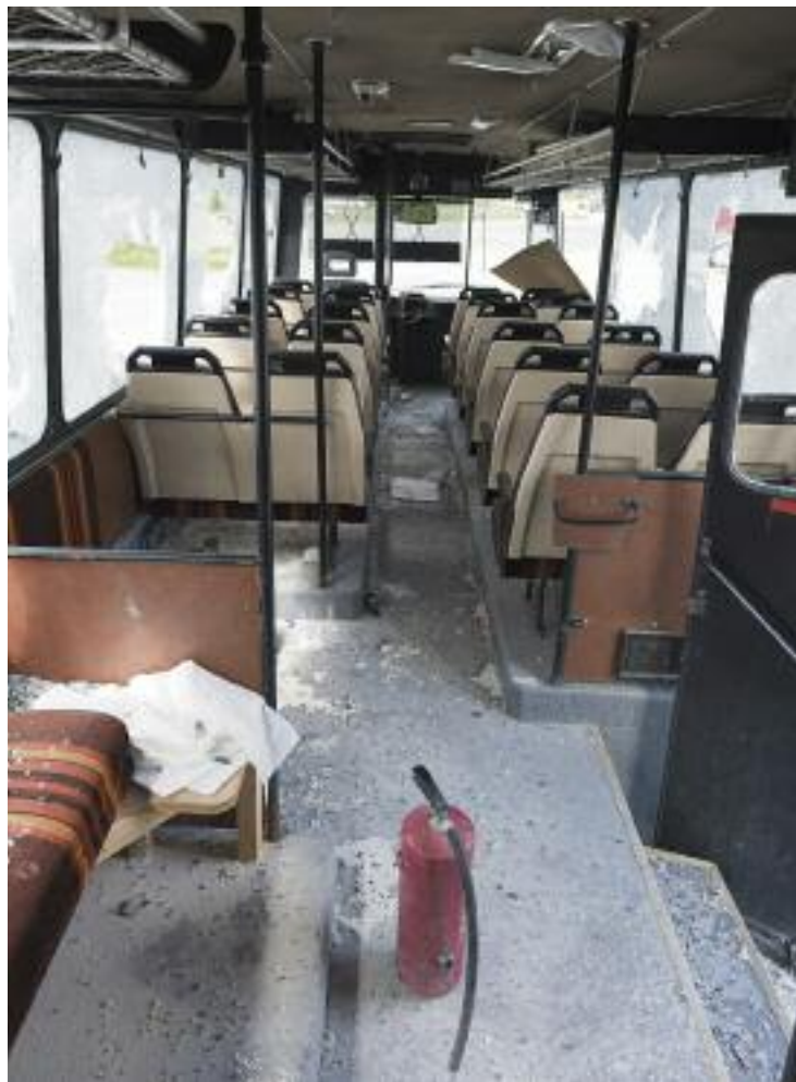
RASERT: Denne bussen, på tomte ved Mekonomen i Salhusmarka Nord, har blitt fullstendig rasert. Politiet mistenker ungdommer fra området for å ha stått bak.