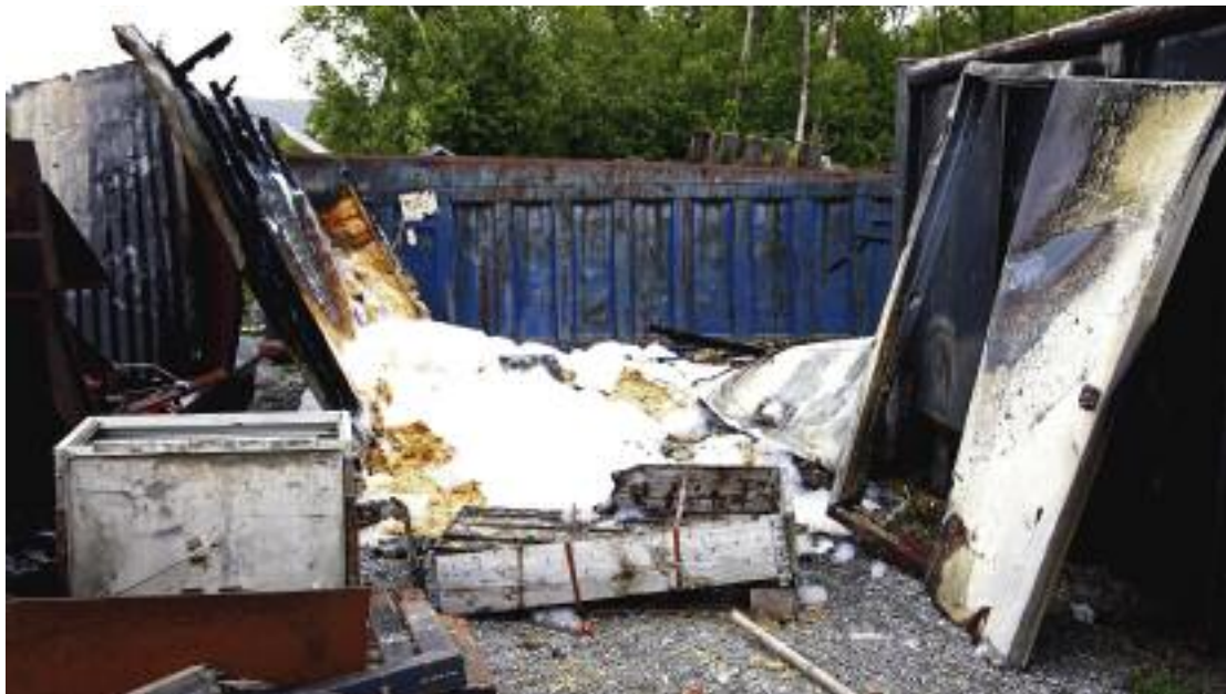
BRANT NED: Dette tennislageret på cirka 2 x 2 meter brant ned til grunnen.