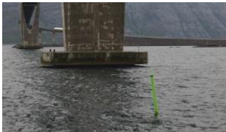
MERKET: Området der vraket ligger er merket med en grønn bøye.