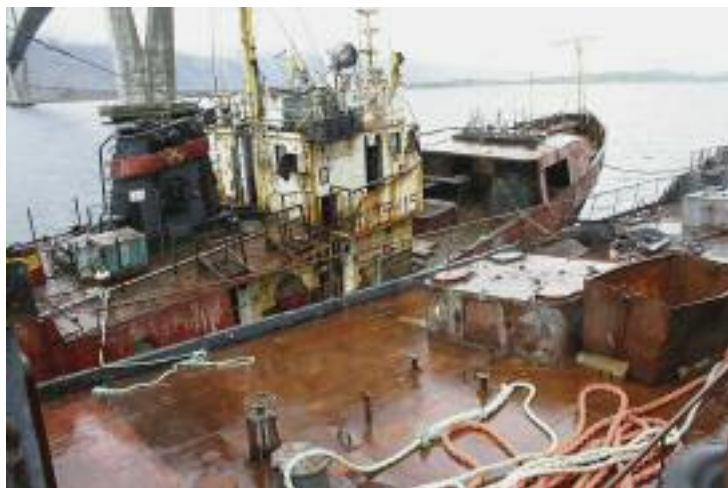
VRAK: Slik så det ut i 2004, før vraket sank.

På bildene kan man blant annet se en ødelagt mast.