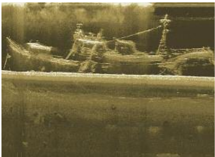
BRUKKET: Dette bildet viser vraket slik det ser ut, med brukket mast og skadet akterparti.